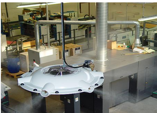
Hoge druk bevochtiging

Bij hogedruk bevochtiging wordt water met 70~100 bar door een verstuiver met een doorlaat van 100-200 µm geperst. Hierdoor breekt de waterstraal direct op. Er ontstaan fijne druppels in de orde van 10~15 µm. De techniek van hogedruk bevochtiging is complexer, maar zeker betrouwbaar en verbruikt tevens weinig energie (0,5 ~ 1,5 kW). Vanwege de kleine nozzles mag er niet teveel kalk in het water zitten.